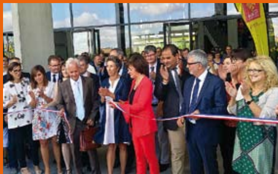
5 septembre Inauguration du lycée Nelson Mandela à Pibrac