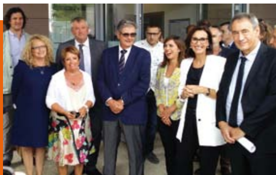
1 er septembre Inauguration de l'école maternelle Jules Ferry à Colomiers

La suspension de session parlementaire, en raison du renouvellement sénatorial de septembre, m'a permis cette année de rester dans le département et ainsi d'assister à plusieurs rentrées scolaires.