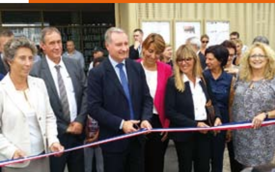
4 septembre Inauguration du groupe scolaire Niboul à Toulouse